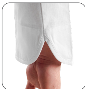
manžeta s rozparkem manžeta s rózparkom cuff with slit mankiet z rozcięciem