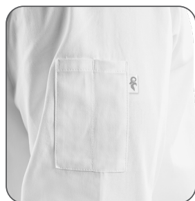
kapsa na rukávu vrecko na rukáve sleeve pocket kieszzeń na rękawie